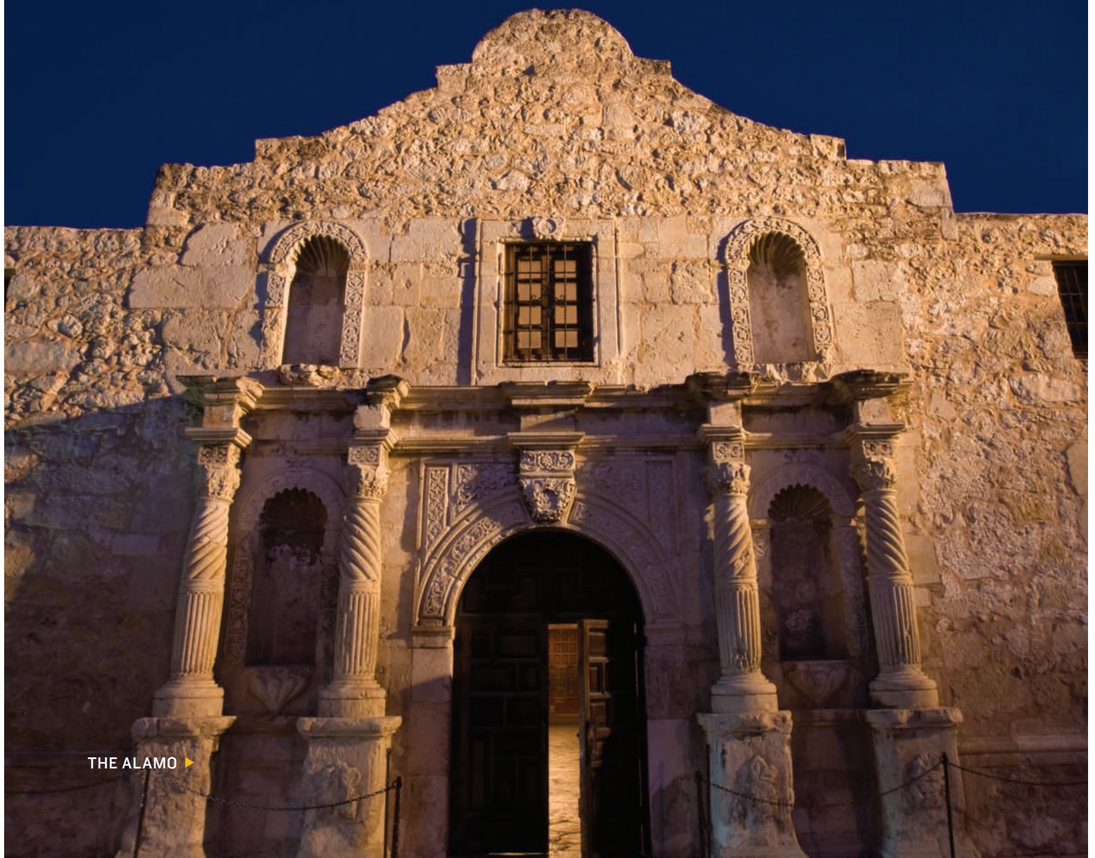
THE ALAMO ▶

PORTE D'ENTRÉE DES PLAINES DU SUD DU TEXAS, SAN ANTONIO INCARNE TOUT ce qu'il y a de meilleur dans la région. La River Walk colorée traverse le centre-ville, où les anciens monuments, missions et églises se fondent dans l'environnement tex-mex historique. Plus au sud, les villes frontalières comme McAllen, Hidalgo et Laredo accentuent l'atmosphère interculturelle des plaines. Les marécages d'Edinburg Scenic Wetlands où les oiseaux et les papillons peuvent être observés dans leur habitat naturel, sont un exemple qui illustre comment les plaines du Sud du Texas sont devenues un paradis pour les ornithologues.