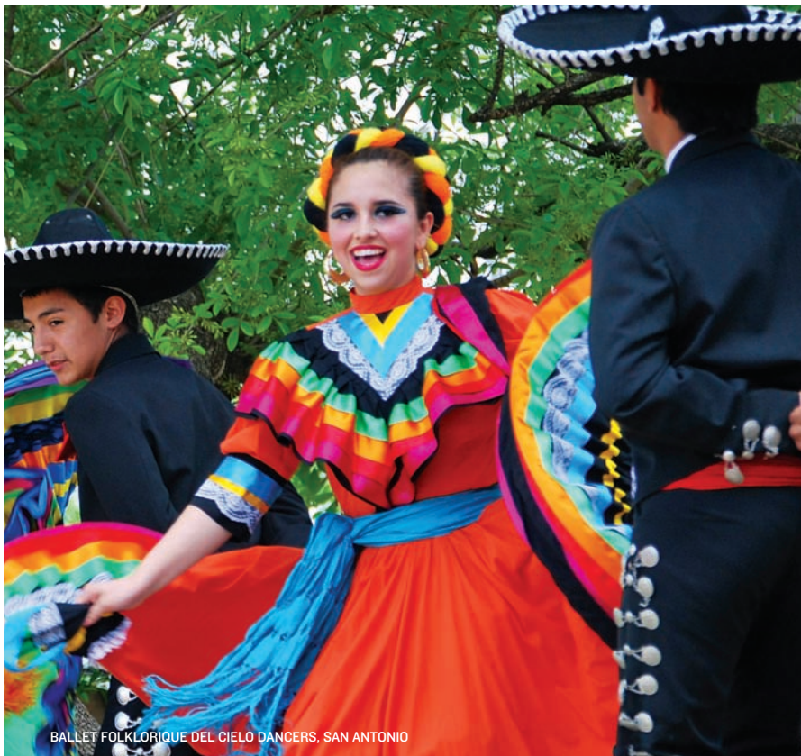
BALLET FOLKLORIQUE DEL CIELO DANCERS, SAN ANTONIO

305 E. Houston St., San Antonio, TX 78205 210-212-4453, sakids.org