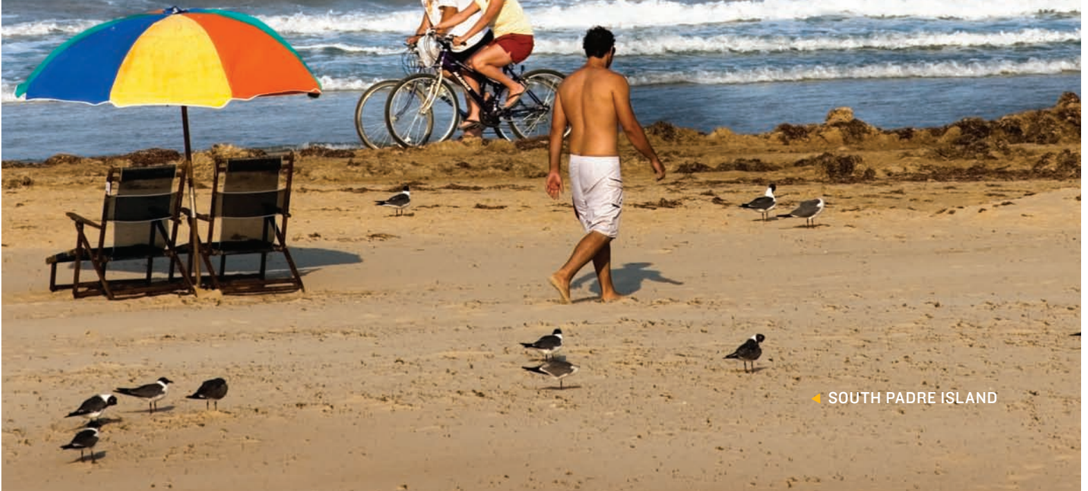
➤ SOUTH PADRE ISLAND

AN DER GOLFKÜSTE GEBEN DIE TEXANISCHEN FARMEN DEN MEERESGEWÄSSERN Raum. Der Ausblick auf das Meer erstreckt sich hier auf einer Strecke von 1.004 Kilometer. Hier ist die einladende Salzwasserfischindustrie beheimatet, mit rund 300 und mehr bekannten Fischarten in den Küstengewässern. Corpus Christi und Galveston sind sehr beliebte Strandmetropolen. Wenn Sie der Straße ein wenig weiter folgen, bietet Houston sowohl ein reifes Angebot an Kunst und Theatern als auch eine Reihe von Museen und das NASA Johnson Space Center. Egal ob Sie die Stadtlandschaft wünschen oder einen Sonnenuntergang über der Bucht genießen möchten, an der Golfküste sind Sie damit goldrichtig.