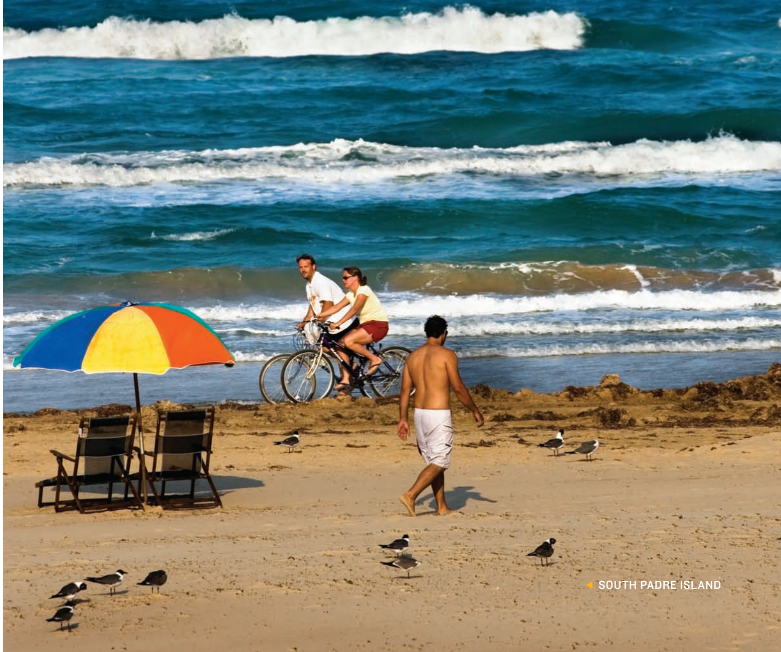
◀ SOUTH PADRE ISLAND

NA COSTA DO GOLFO, AS FAZENDAS DO TEXAS SE ABREM PARA O MAR, onde a vista do oceano se alonga por 1.004 quilômetros. A indústria da pesca em água salgada é proeminente, e mais de 300 espécies de peixes são encontradas nas águas do litoral. Corpus Christi e Galveston são cidades litorâneas populares. Não muito longe, Houston oferece muita arte e teatro, uma série de museus e o Johnson Space Center da NASA. Se você quer a vida da metrópole ou prefere assistir ao pôr-do-sol na baía, a Costa do Golfo é o lugar para ir.